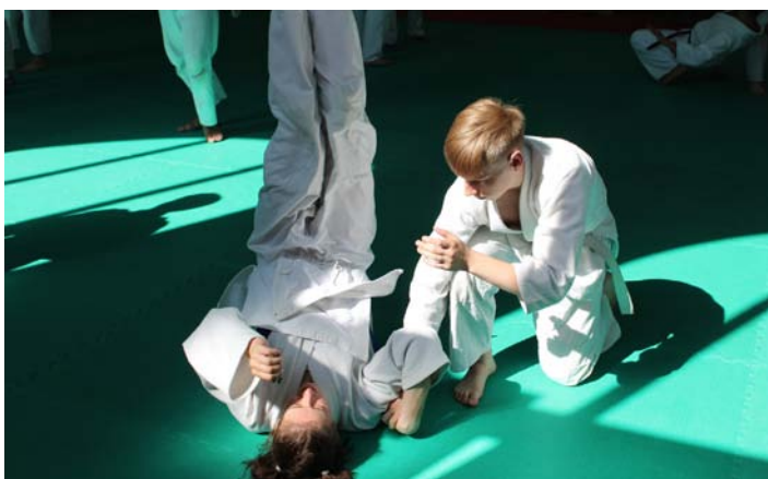
V aikidu nepotřebujete až tak moc síly, protože využijete tu protivníkovu