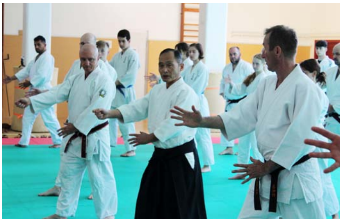
V Česku sensei učil žáky jak základní, tak pokročilejší aplikované techniky