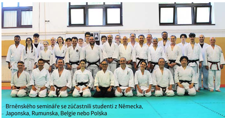
Brněnského semináře se zúčastnili studenti z Německa, Japonska, Rumunska, Belgie nebo Polska

Techniky aikida jsou založeny na využití síly i energie protivníka a koordinace pohybu s jeho akcí. Díky tomu aikido nevyžaduje velkou svalovou dynamiku a mohou jej cvičit takřka všichni lidé bez ohledu na věk a pohlaví. Technika