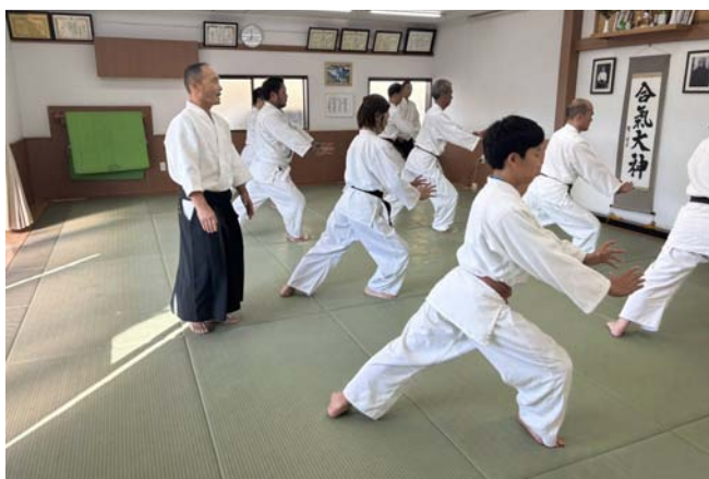
Andovo dódžo se nachází ve městě Urajasu v prefektuře Čiba

Nevnímám to každopádně jako něco negativního – náš cíl nespočívá v tom, aby jóšinkan dělalo co nejvíce studentů.