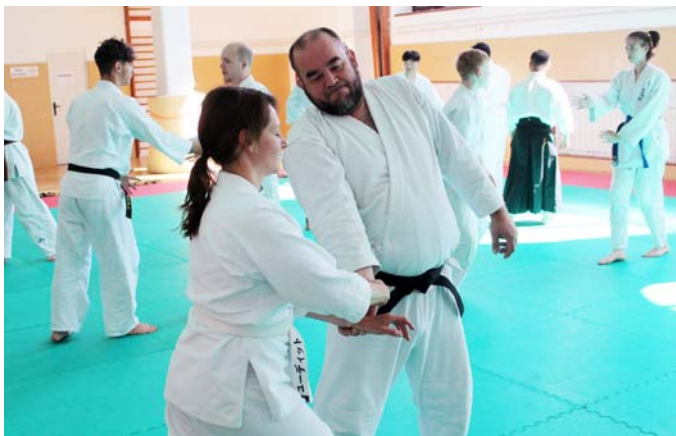
Aikidu jōshinkan se běžně věnují i ženy, děti či senioři

aplikovali v reálném životě. Spíše se jej učíme ovládnout tak, abychom ho vůbec použít nemuseli. Svět se od dob vzniku aikida změnil. Pokud by se tak nestalo, lidstvo by postupně upadalo. Z tohoto důvodu se muselo vyvinout a proměnit také aikido, jež člověka naopak rozvíjí.